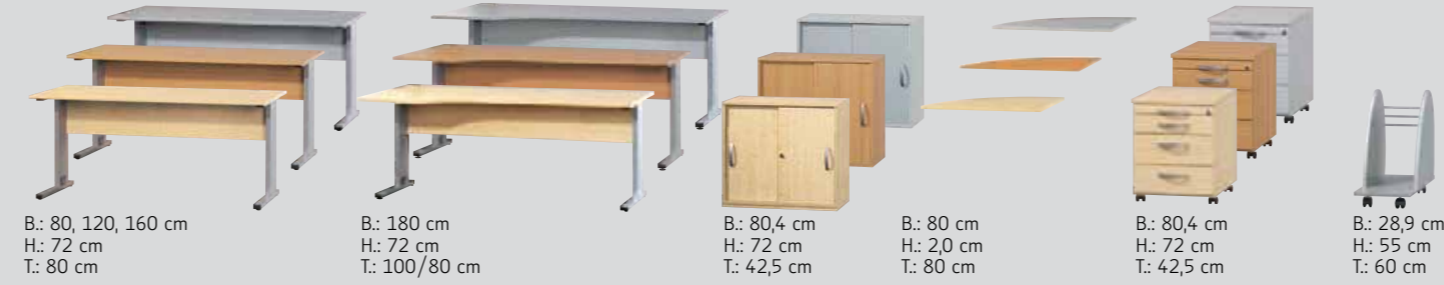
Schreibtischplatten inkl. 2 Kabeldurchlässe/Desktop panels incl. 2 cable entry points