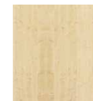
Kunststoffoberfläche Ahorn Nachbildung Synthetic finish Maple effect

For individual assembly and combinations made possible by 3 different designs, e.g. file shelf in light grey and front in maple effect with desk to match the Corpus.