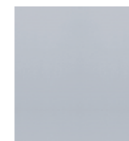
Kunststoffoberfläche hellgrau Synthetic finish Light grey