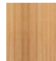
Kunststoffoberfläche Buche Nachbildung Synthetic finish Beech effect