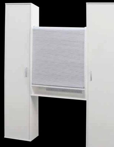
Hochstehend als Zwischenbauteil Upright between cabinets