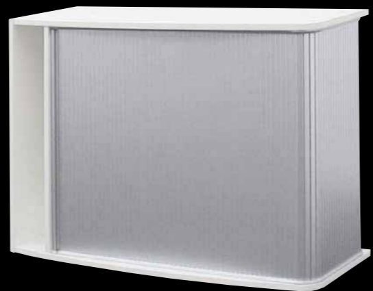
Querstehend auf Sockelfüßen Horizontal on a plinth base

The rounded roller blind element can be used as an upright, stacked or hanging unit between cabinets. A set of castors is available to add mobility to the roller blind element. The storage shelf with CD rack provides optimum order in the office.