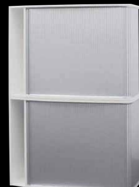
Querstehend gestapelt Horizontal stacked