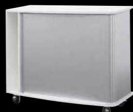
Querstehend auf Rollen Horizontal on castors